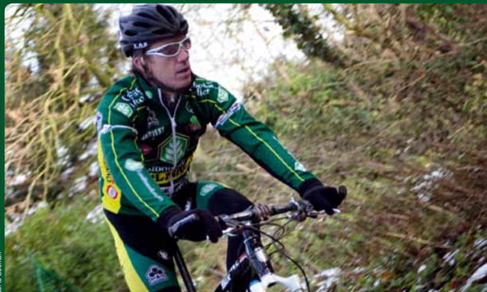
verantwoordelijke uitgever: Vlaamse overheid, Christine Claes, secretaris-generaal CISA

"Mountainbike was mijn leven, daar heb ik alles aan te danken. Toch heb ik spijt dat ik mij die keer liet verleiden tot het gebruik van doping... Dat blijft een smet op mijn palmares. Daarom één gouden raad: blijf eraf!"