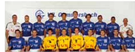
Gummersbach seizoen 2005 - 2006