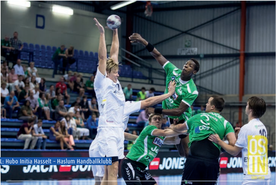
EHF CL: Hubo Initia Hasselt – Haslum Handballklubb

met hun sport en hun trainingen, supportersbegeleiding, allerlei publicitaire acties...Ik doe die vier functies dus zo'n beetje in mijn eentje en ik heb de voorbije maanden al een pak bijgeleerd. Je merkt als speler b.v. wel dat er zoiets bestaat als 'led boarding', maar hoe dat werkt en wat je daarvoor moet doen, daar sta je als speler niet bij stil. Het geraakt ook stilaan bekend dat ik de taak van manager uitoefen en ze bellen steeds meer naar mij over allerlei aspecten van het clubleven. Door het feit dat deze functie bestaat, wordt ook de taak verlicht van een aantal bestuursmensen, die zich nu beter kunnen concentreren op hun specifieke functies."