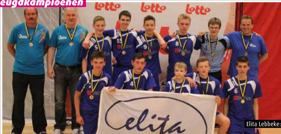
Elita Lebbeke: J16