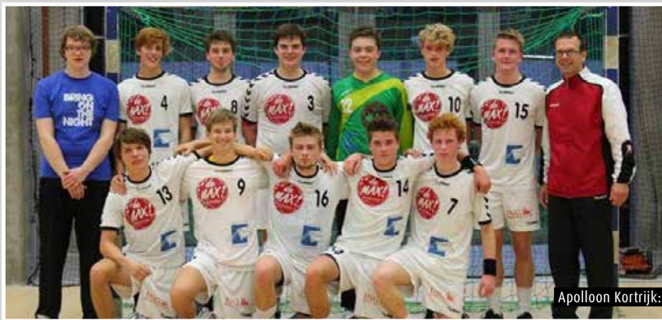
Apollon Kortrijk: J22