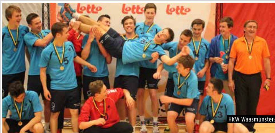
HKW Waasmunster: J18