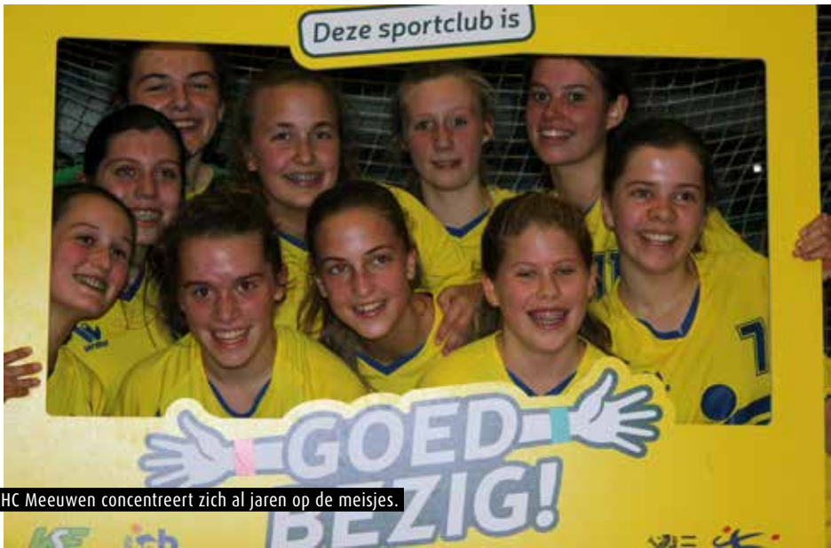
DHC Meeuwen concentreert zich al jaren op de meisjes.