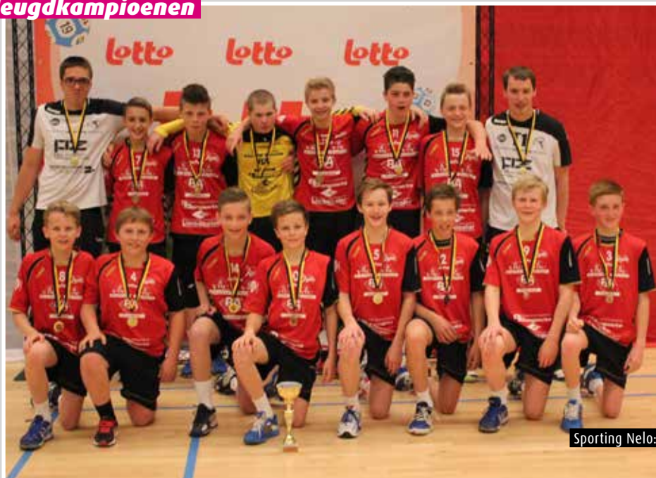
Sporting Nelo: J14