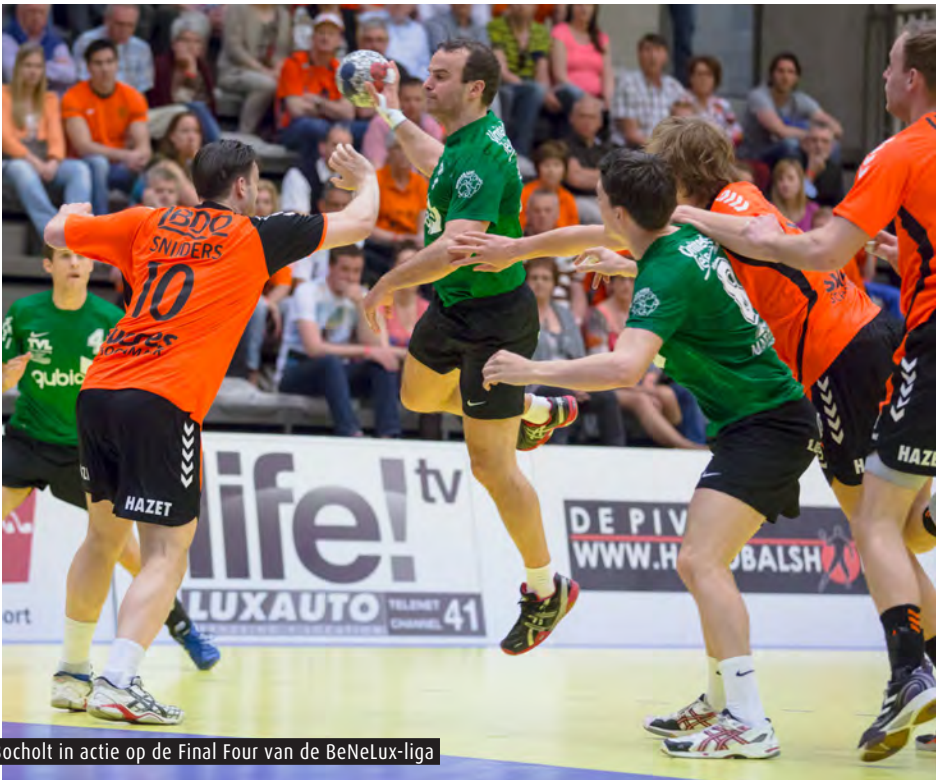
Bocholt in actie op de Final Four van de BeNeLux-liga