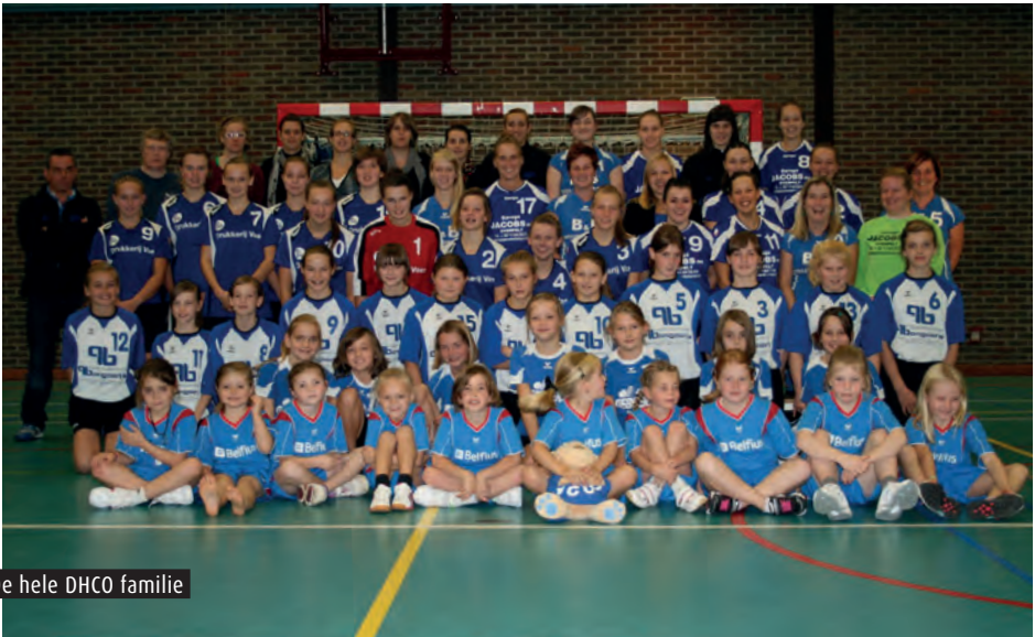
De hele DHCO familie