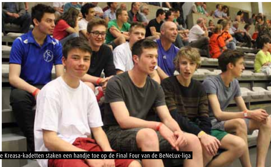
De Kreasa-kadetten staken een handje toe op de Final Four van de BeNeLux-liga