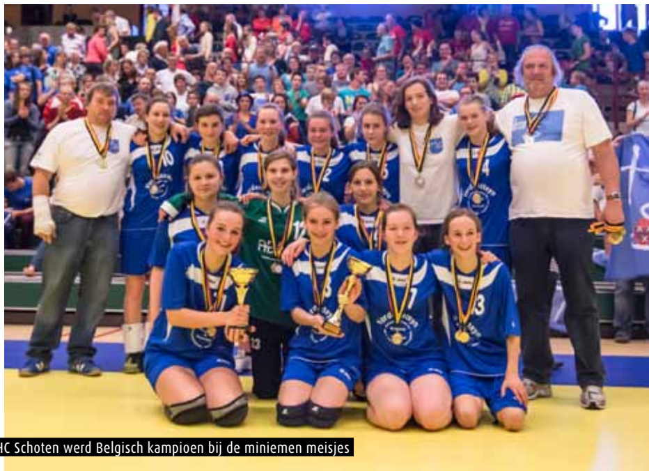
HC Schoten werd Belgisch kampioen bij de miniemen meisjes

maar die namen enkel deel aan toernooien.'