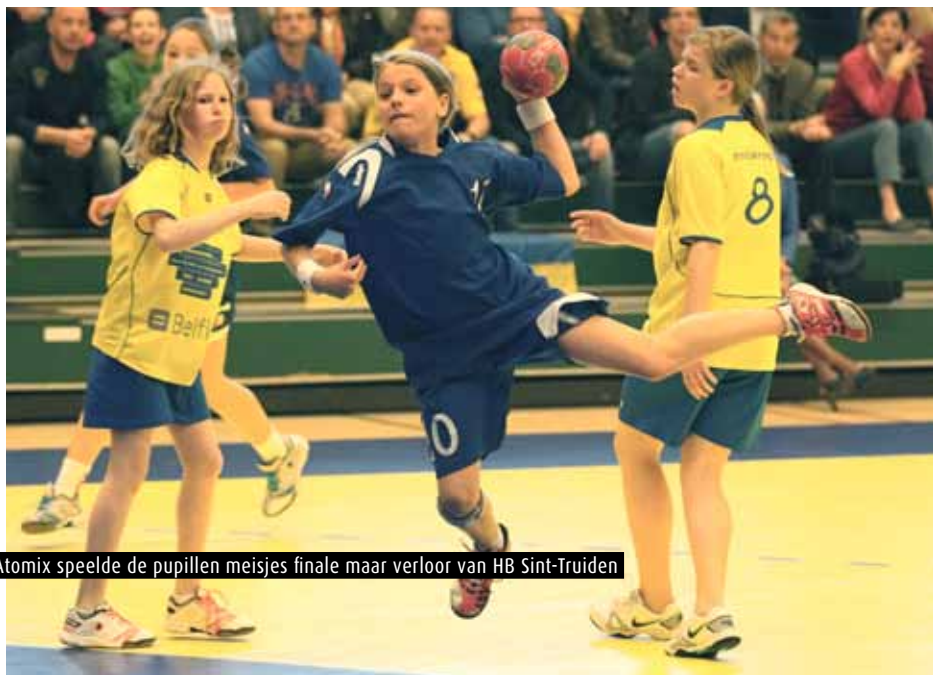
Atomix speelde de pupillen meisjes finale maar verloor van HB Sint-Truiden