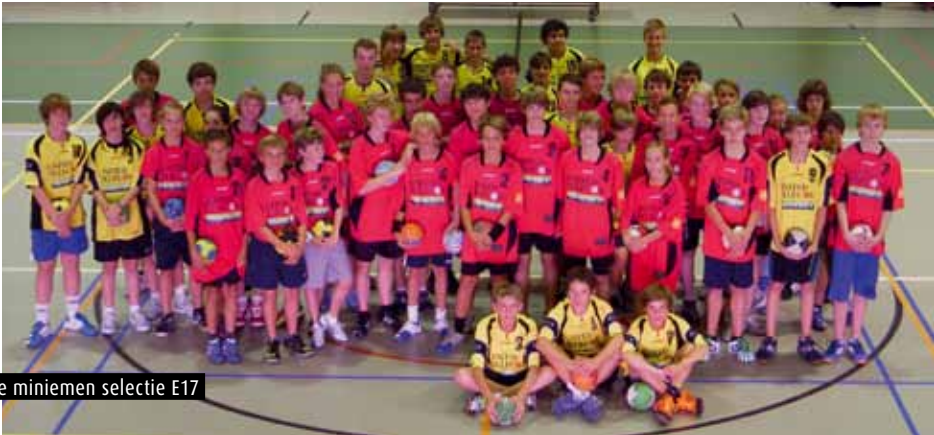
De miniemen selectie E17

deelt in kleine groepjes om korte wedstrijdes te spelen, telkens met positiewijzigingen. Zo kregen we al een min of meer complete indruk van hun mogelijkheden. Kijk, het uiteindelijke doel van die vernieuwde aanpak is te werken naar 2020 toe. Dan hebben die talenten de leeftijd van 21 à 22 jaar bereikt en moeten ze er staan. Waarvoor? Om door de kwalificaties voor een EK of WK te raken bijvoorbeeld. Akkoord, dat klinkt misschien ambitieus, maar je moet nu eenmaal doelen durven stellen. ‘