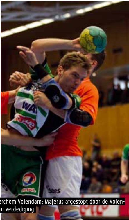
Berchem Volendam: Majerus afgestopt door de Volendam verdediging

we zowel tegen Hasselt als tegen Sasja niet goed bezig, gisteren tegen Berchem evenmin. Ik heb ze achteraf gevraagd: wat scheelt er? Is dit een collectief of een verzameling individuen? En die boodschap hebben ze wel begrepen. Ik stond versteld van hun reactie. Of we nu een mentale klap hebben uitgedeeld? Ik denk het niet...'