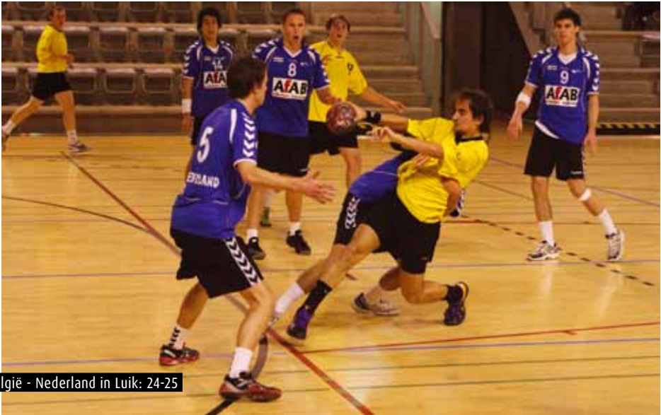
België - Nederland in Luik: 24-25