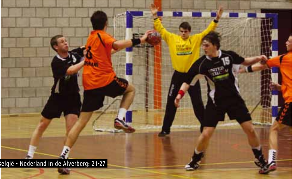
België - Nederland in de Alverberg: 21-27

Op 7, 8 en 9 januari 2011 wordt in Luik het WK-kwalificatietornooi U21 gespeeld. Onze nationale junioren krijgen Polen, Hongarije en Roemenië voorgeschoteld. Geen makkie, evenmin een mission impossible, als we bondscoach Michel Kranzen mogen geloven. Voor deze generatie U21 betekent dit tornooi een afscheid. 'Dit is hun laatste kans om zich voor een groot internationaal tornooi te kwalificeren. Daarna zullen ze het bij de grote jongens moeten bewijzen...,' weet Michel Kranzen.v