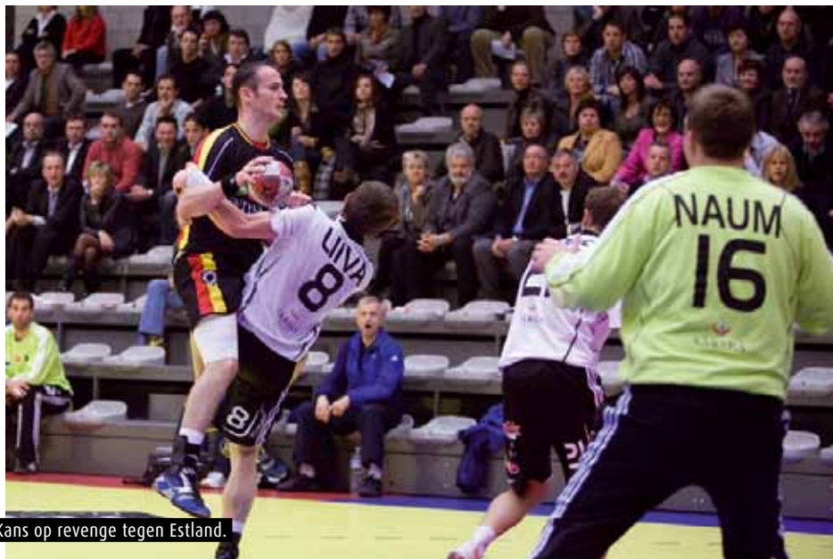
Kans op revanche tegen Estland.