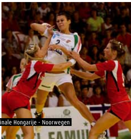
Finale Hongarije - Noorwegen

Daarnaast waren er ook enkele Finnen, Tsjechen, Fransen, ... en zelfs enkele Japanners aanwezig (zij waren helaas vooral geïnteres-