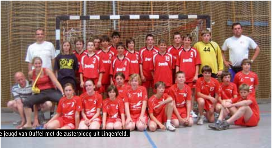
De jeugd van Duffel met de zusterploeg uit Lingenfeld.

Duffel bleef drie jaar in 's lands topklasse, werd in 1981 nogmaals kampioen in tweede, maar dan was het verblijf in eerste nationaal van kortere duur.