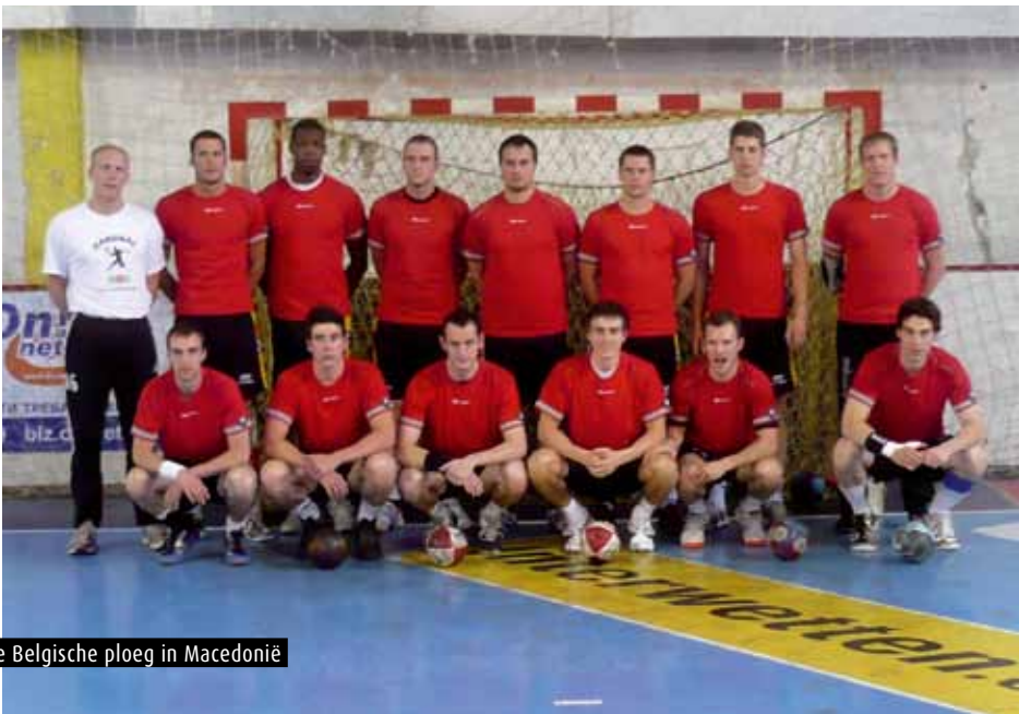
De Belgische ploeg in Macedonië