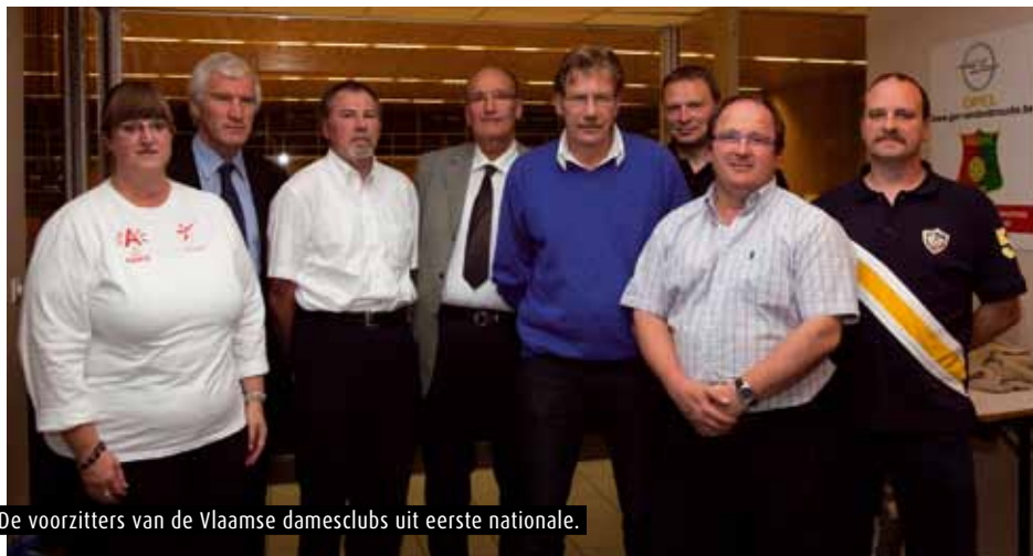
De voorzitters van de Vlaamse damesclubs uit eerste nationale.