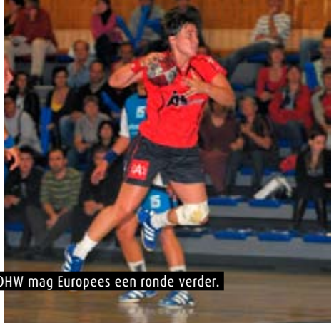
DHW mag Europees een ronde verder.

Er is dus veel werk aan de winkel. In die optiek werd overigens ook een nieuwe damescommissie opgericht. Kijk, ik constateer dat specifieke damesclubs als Visé, Meeuwen, Waasmunster