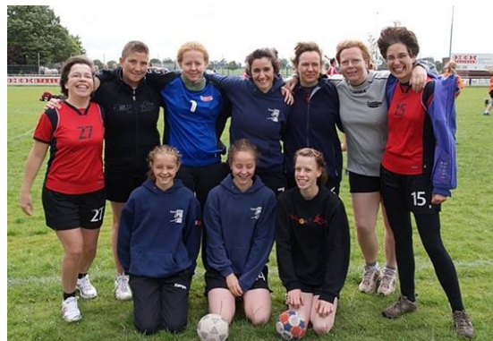
Fithandballers (recreanten) HV Uilenspiegel